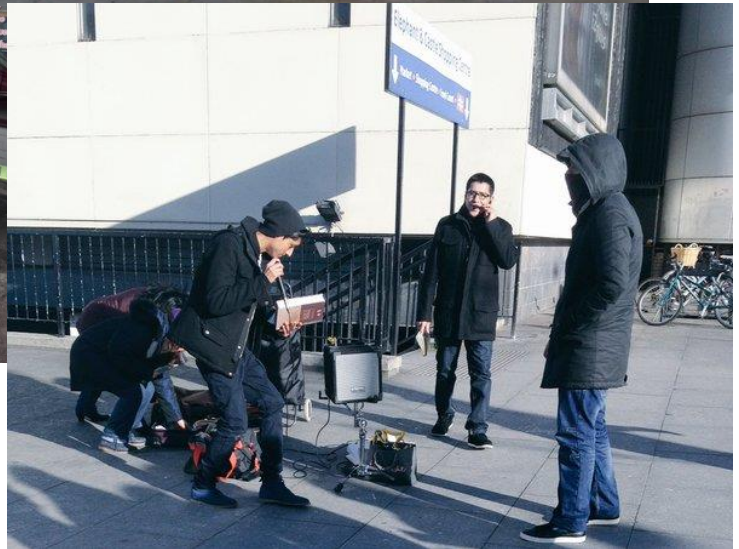
Visita a Elephant and Castle.